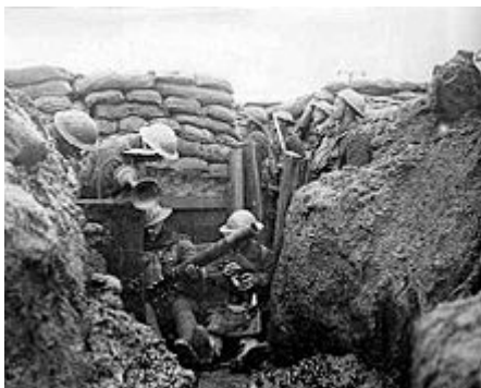
Soldaten in een loopgraaf

Het leven in de loopgraaf was een nachtmerrie. Loopgraven vormden, met name in het voorjaar, winter en herfst, modderige geulen waarin men tot de knieën in de modder zakte. Alles werd vochtig en smerig en het water drong door kleren en laarzen heen. Dit leidde onder meer tot "loopgravenvoeten", het verweken van langdurig natte voeten met sterk vergrote kans op beschadigingen en daardoor infecties met als uiterste gevolg dood door gangreen. Soms werd gebruikgemaakt van houten planken om de begaanbaarheid te verbeteren, in Duitse loopgraven was dit iets sneller gebruikelijk. Lijken konden vaak door de omstandigheden en de grote aantallen, niet snel worden begraven. Op de lijken en ander afval kwamen ratten af, die zich in hoog tempo konden vermenigvuldigen. Slechts als een deel van het front langere tijd 'in rust' was kon er enige verbetering in de leefomstandigheden worden gerealiseerd.