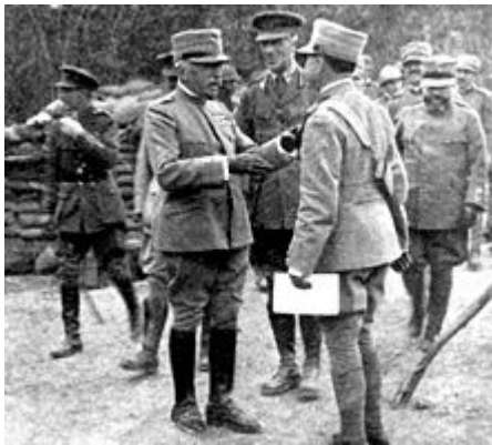
Maarschalk Luigi Cadorna

Italië was voor de beloften van de geallieerden gezwicht. De Centralen zagen dit als verraad, aangezien Italië met Oostenrijk en Duitsland de Driebond had. Maar Italië was meer een last dan een steun; het economisch zwakke land moest door Groot-Brittannië van steenkool en krediet worden voorzien en de Italiaanse soldaten moesten steeds worden geholpen door Franse soldaten. Bovendien keken de Italianen niet verder dan de Oostenrijkse gebieden die hen toe zouden komen. De Piëmontezen weerden zich kranig, maar bij de Zuid-Italiaanse troepen ontbrak de motivatie om te vechten.