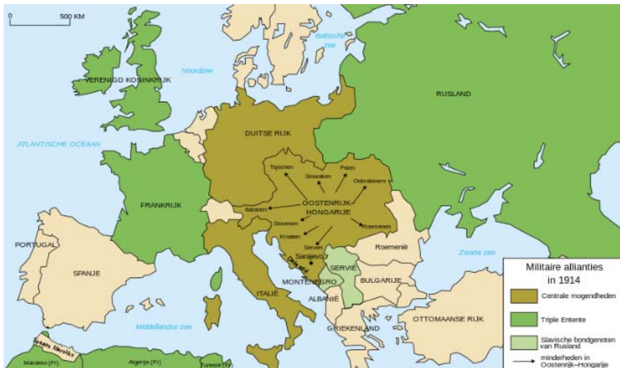
Kaart van Europa bij uitbraak van de oorlog

De Triple Entente, onder meer Frankrijk, het Verenigd Koninkrijk, Keizerrijk Rusland (tot 1917), Italië (vanaf 1915) en de Verenigde Staten (vanaf 1917) streidden samen tegen de Centrale Mogendheden , gevormd door Oostenrijk-Hongarije, Duitsland, Bulgarije en het Ottomaanse Rijk. Het was de eerste oorlog waarin fabrieksmatig en snel geproduceerde middelen en de techniek de overhand kregen, zoals machinegeweren, gifgas, kanonnen en prikkeldraad, en waarin tanks en vliegtuigen algemeen in gebruik genomen werden. De gebruikte tactieken dateerden echter nog uit de 19e eeuw en dat was volgens polemologen een van de oorzaken van de enorme aantallen doden en gewonden. Een belangrijke factor die ook bijdroeg aan de massale opoffering van mensenlevens was de mogelijkheid enkele jaren achtereen constant opeenvolgende lichteningen met duizenden jonge mannen als dienstplichtigen op te roepen, naar de fronten te voeren en daar in te zetten. Deze inzet werd vooral berucht doordat er vaak ondanks de opoffering van zeer grote aantallen militairen slechts futiele successen konden worden gemeld, zoals de verovering van kleine stukjes veelal kapotgeschoten niemandsland, die vervolgens over en weer opnieuw moesten worden verdedigd of heroverd met even massale tegenaanvallen, de zogenoemde stellingenoorlog.