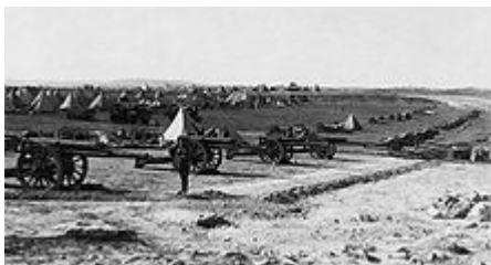
Britse artillerie voor de inname van Jeruzalem in 1917

Voordat de oorlog uitbrak, had het Ottomaanse Rijk goede contacten met onder andere de Britten en de Duitsers, die hen sporadisch hadden geholpen in de oorlogen tegen het Russische Rijk. Het Ottomaanse Rijk