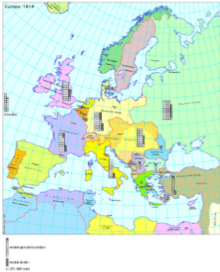
Aantal gemobiliseerden en doden in de Oorlog

Onderstaand kaartje laat zien hoeveel soldaten per oorlogvoerend land op de been werden gebracht en hoeveel dodelijke slachtoffers er vielen. In de aantallen aangegeven voor Engeland zijn tevens de gebieden meegeteld die destijds deel uitmaakten van het Britse Rijk.