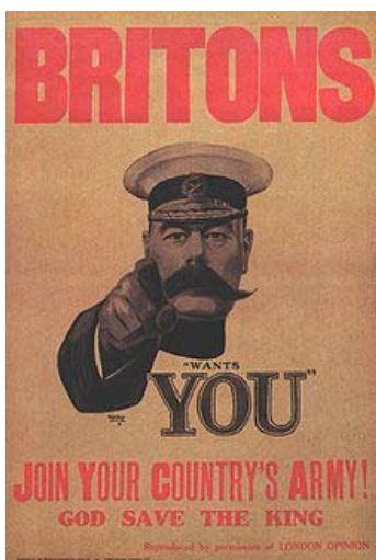
Een van de vele rekruteringsposters.