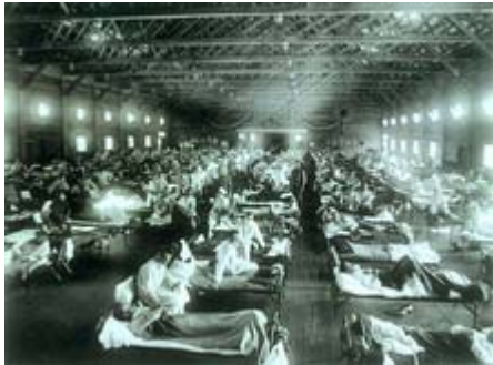
Amerikaans militair hospitaal met griepslachtoffers

In 1918 verspreidde zich een griepgolf over de wereld. Het bestaan hiervan werd bekend via de Spaanse media die begonnen te berichten over een griepgolf waaraan mensen stierven. Hierdoor was de griep al snel bekend als de Spaanse griep. Deze griepgolf bleek afkomstig van de Amerikaanse troepen die naar Europa waren gezonden. De Amerikanen besmetten ook andere legerkorpsen: de Engelsen, de Fransen en uiteindelijk ook de Duitsers. Toen de troepen na de oorlog terugkeerden, verspreidde de griep zich door de feestelijke parades waarin de troepen onthaald werden.