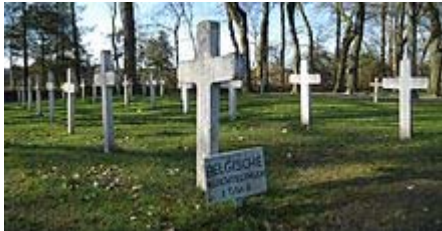
Graven van Belgische vluchtelingen op de begraafplaats van het Nederlandse dorp Veenhuizen (Drenthe, 2009)

Na de Duitse inval sloegen vele Belgen op de vlucht. Duizenden trokken via Oostende en Zeebrugge naar Engeland. Evenveel trokken verder naar Frankrijk. Meer dan honderdduizend vluchtelingen trokken naar Nederland. Onder deze vluchtelingen bevonden zich ook 35.000 militairen, die werden geïnterneerd. Nederland was als neutraal land zagezegd gebonden ervoor te zorgen dat troepen en middelen van de strijdende partijen die op zijn grondgebied terechtkwamen niet meer aan de strijd zouden kunnen deelnemen. Duizenden "gemotiveerde" Belgische militairen zouden ontsnappen om via Groot-Brittannië en Frankrijk, toch weer deel te nemen aan de oorlog.