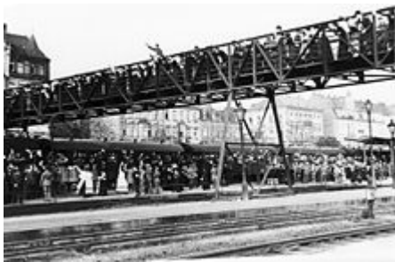
Duitse troepen nemen in 1914 te Fürth de trein naar het front

➤ Zie Duitse opmars door België tijdens de Eerste Wereldoorlog voor het hoofdartikel over dit onderwerp.