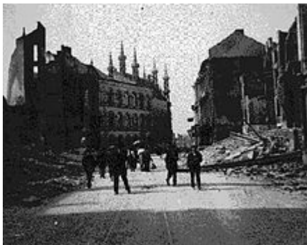
Leuven in 1915

België hield zich aan de afspraak om neutraal te blijven en de Duitsers niet door te laten. Maar de Duitse legerleiding hield geen rekening met deze neutraliteit en Duitsland viel België alsnog binnen.