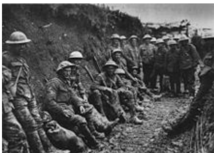
Royal Irish Rifles in een loopgraaf tijdens de Slag aan de Somme. (waarschijnlijk 1st Battalion, Royal Irish Rifles (25th Brigade, 8th Division).