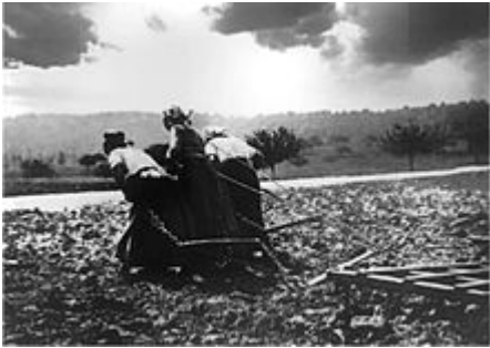
Drie vrouwen ingezet om een ploeg te trekken in Oise, 1917.