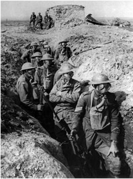
Australische infanteristen bij Ieper dragen gasmaskers, 1917.

In de eerste maand van de oorlog, augustus 1914, vuurden Franse soldaten traangas (xylylbromide) naar de Duitsers en waren daarmee de eersten die gifgas gebruikten. Het Duitse leger was echter het eerste dat intensief onderzoek deed naar gifgas, onder leiding van de eminente Duitse chemicus Fritz Haber, en was het eerste dat het in 1915 op grote schaal gebruikte.