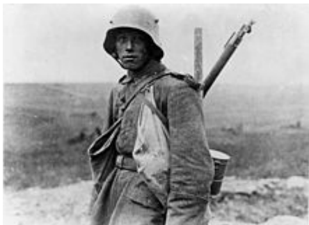
Een Duits infanterist aan de Somme in 1916