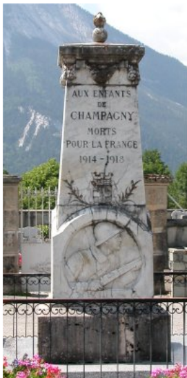
Frans monument ter ere van de gesneuvelden tijdens de Eerste Wereldoorlog

Het was een oorlog die begon met de militaire tactieken van de Frans-Duitse Oorlog van 1870. Met charges van de cavalerie, massale inzet van de infanterie en al even massale als vergeefse bajonetaanvallen. Aan