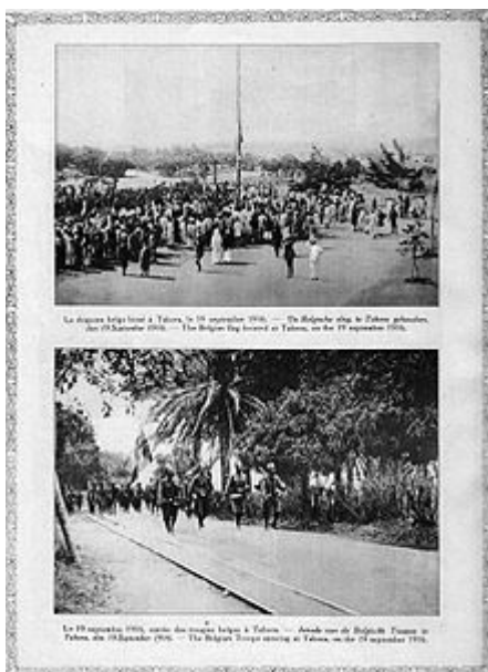
Inval van het Belgisch leger in Tabora

Door de geallieerde controle van de zeeën konden de Duitsers hun koloniën niet bevoorraden. Met een defensieve strategie werd gepoogd de koloniën te behouden tot de eindoverwinning in Europa en geallieerde troepen te onttrekken van het Europees front.