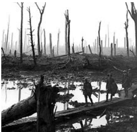
Een bos bij Ieper in 1917 na beschietingen